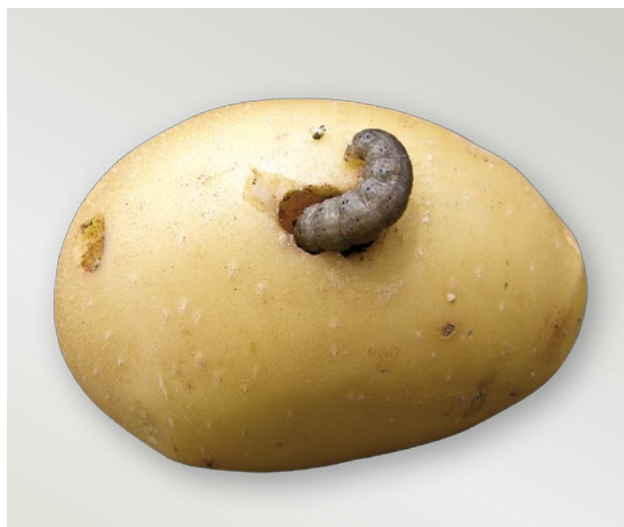
Housenka osenice v hlíze