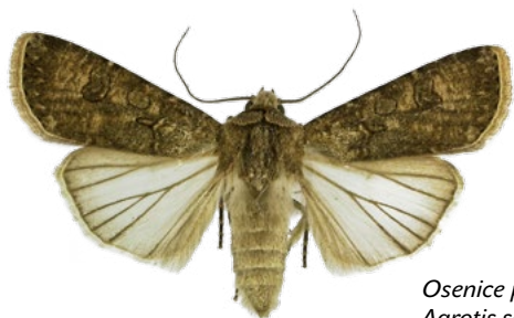
Osenice polní Agrotis segetum