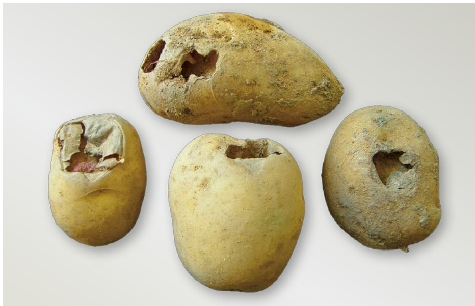
Hlízy poškozené osenicí

Zejména u osenice polní dochází k periodickým gradacím. Nejvyšší výskyt je po tuhé zimě a suchém jaru. V teplých zimách hmyz špatně přezimuje a housenky a kukly podléhají napadení entomofágními houbami. Ve vlhkém jaru hyne značné procento vajíček.