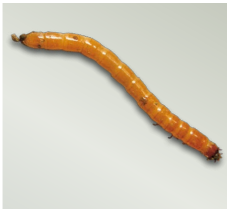
Larva kovaříka - drátovec