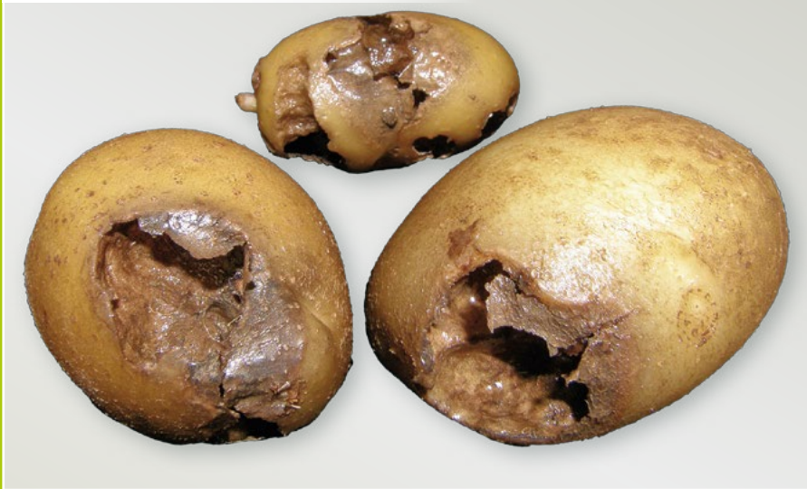
Silné poškození hlíz osenicí polní

VÝZKUMNÝ ÚSTAV BRAMBORÁŘSKÝ HAVLÍČKŮV BROD