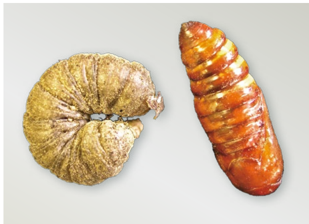
Kukla a housenka osenice polní

V porostech brambor, které jsou ošetřovány insekticidy proti mšicím (sadbové) nebo proti mandelince, dochází většinou i k výraznému snížení populace housenek osenic těmito přípravky.