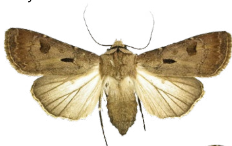
Osenice vykřičnicková Agrotis exclamationis

Osenice jsou polyfágní druhy nočních motýlů. Škody nejčastěji způsobují osenice polní ( Agrotis segetum ), osenice ypsilonová ( Agrotis ypsilon ) a osenice vykřičnicková ( Agrotis exclamationis ). Všechny tři druhy mají podobný životní cyklus. Přezimovat může housenka, kukla i dospělec. V našich podmínkách mají osenice jedno pokolení v roce. Imaga létají koncem května a v červnu. Po páření kladou samičky až několik set vajíček, které přilepují na různé části rostlin, často na lebedy a merlíky. Vajíčka jsou odolná vůči suchu, ale citlivá vůči vlhkosti. Líhnutí housenek probíhá po 5–20 dnech podle průběhu teploty. Housenky se pětkrát svlékají a jejich vývoj trvá až 4 měsíce. Přibližně po měsíci vývoje přes den zalézají do půdy, kde se živí na podzemních částech rostlin, v noci vylézají na rostliny a okusují listy. Od této doby také způsobují největší škody. Za potravou mohou putovat i několik set metrů. Kuklí se v zemi. Motýli se líhnou po 1–3 týdnech.