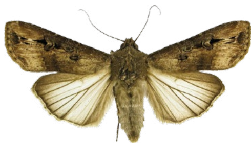
Osenice ypsilonová Agrotis ypsilon