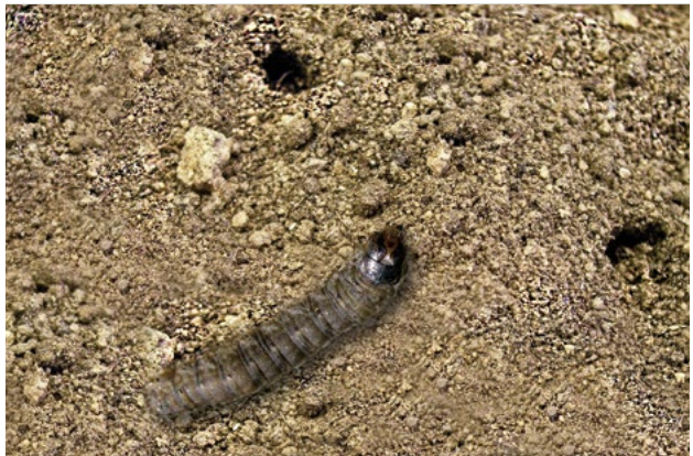
Otvory v půdě způsobené housenkami osenic