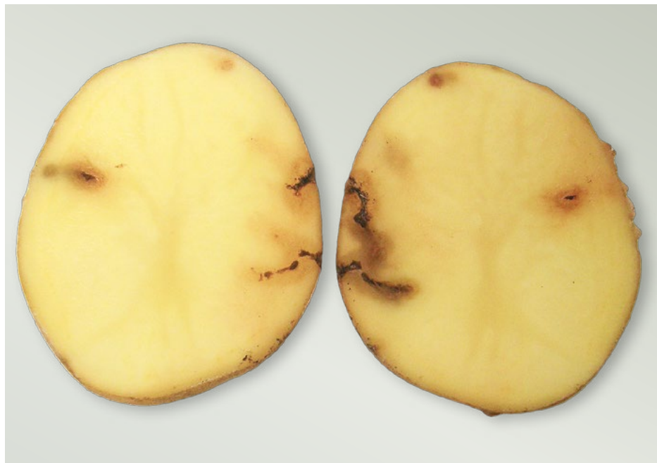
Poškození drátovcem na řezu hlízou

hloubky podle druhu a velikosti larev , které jsou vyplněny tmavým trusem. Především škodí larvy vyšších vývojových stádií. Znehodnocují kvalitu především konzumních hlíz a mohou do nich také zanášet některé původce hnilob. Drátovce lze však zastihnout přímo v napadené hlíze jen zřídka, neboť při manipulaci s hlízami při sklizni je rychle opouštějí a vypadávají do půdy. S drátovci se můžeme setkat už na matečných hlízách, u nových hlíz se jejich poškození zvyšuje v závěru vegetace a v době mezi jejím ukončením a sklizní. K napadení hlíz dochází nejen z důvodu doplnění potravy, ale v době přisušku jsou živá rostlinná pletiva pro larvy důležitým zdrojem vody. Výskyt drátovců a jimi způsobených škod je u brambor nejčastější v zahradách a na menších pozemcích sousedících s travními porosty nebo pokud jsou brambory vysázeny po pícninách nebo trvalých travních porostech. V posledních letech však poškození hlíz brambor drátovci stoupá také v souvislosti s minimalizací obdělávání půdy a se změnou struktury rostlinné výroby. Např. stoupající plochy kukuřice v bramborářské oblasti a množství nerozložených rostlinných zbytků po této plodině poskytují dostatek potravy také pro larvy kovaříků a při jejich dlouhodobém vývoji se tvoří vysoký potenciál těchto škůdců pro následné plodiny.