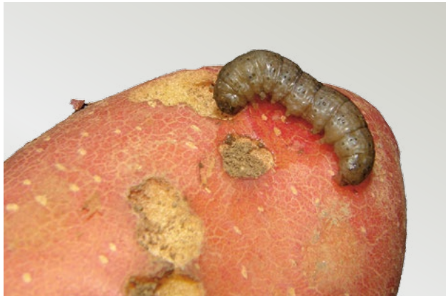
Housenka osenice při žíru