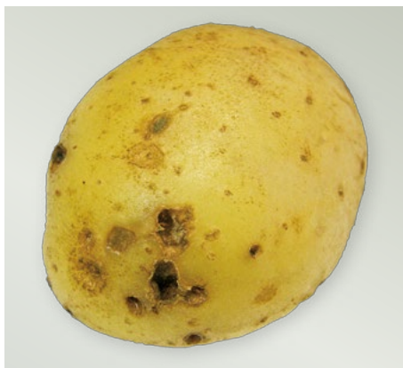
Hlíza poškozená drátovcem