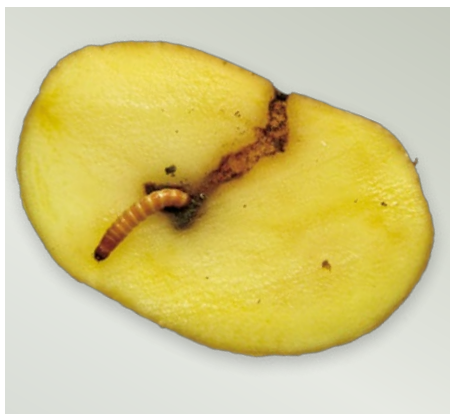
Chodbička drátovce může zasahovat velmi hluboko do hlízy

Při manipulaci s hlízami je drátovci rychle opouštějí