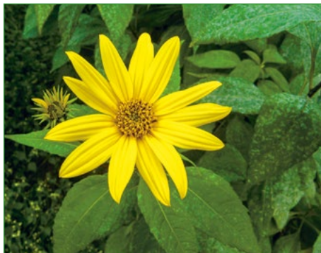
Obr. 1a: Květ topinamburu

Hlízy topinamburu mají podobný obsah sušiny jako hlízy bramboru. Hlavní zásobní látkou je inulin, polysacharid složený z molekul fruktózy. Kromě toho hlízy obsahují též vitaminy a řadu minerálních látek, z nichž nejdůležitější je draslík.