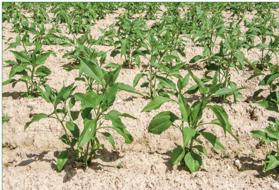
Obr. 3: Mladé rostliny topinamburu

Hlízy je možné vysazovat na podzim i na jaře. U podzimní výsadby je předpoklad časnějšího vzházení a lepšího využití zimní vláhy rostlinami. Hrozí zde ale vysoké riziko poškození či úplného zničení vysázených hlíz hryzci a hraboši v zimním období. Hlízy topinamburu je nejlépe sázet do hrůbků, podobně jako brambory. V hrůbcích mají rostliny lepší podmínky pro rozvoj kořenové soustavy a tvorbu hlíz. Druhým důvodem, proč se topinambur v hrůbcích pěstuje, je i použití mechanizace pro pěstování brambor. Při pěstování na menších plochách a zahrádkách lze pěstovat topinambur „v rovině“, to znamená bez vytváření hrůbků.