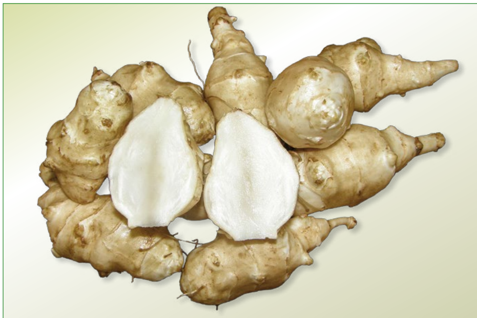
Obr. 2: Hlízy topinamburu připravené ke konzumaci