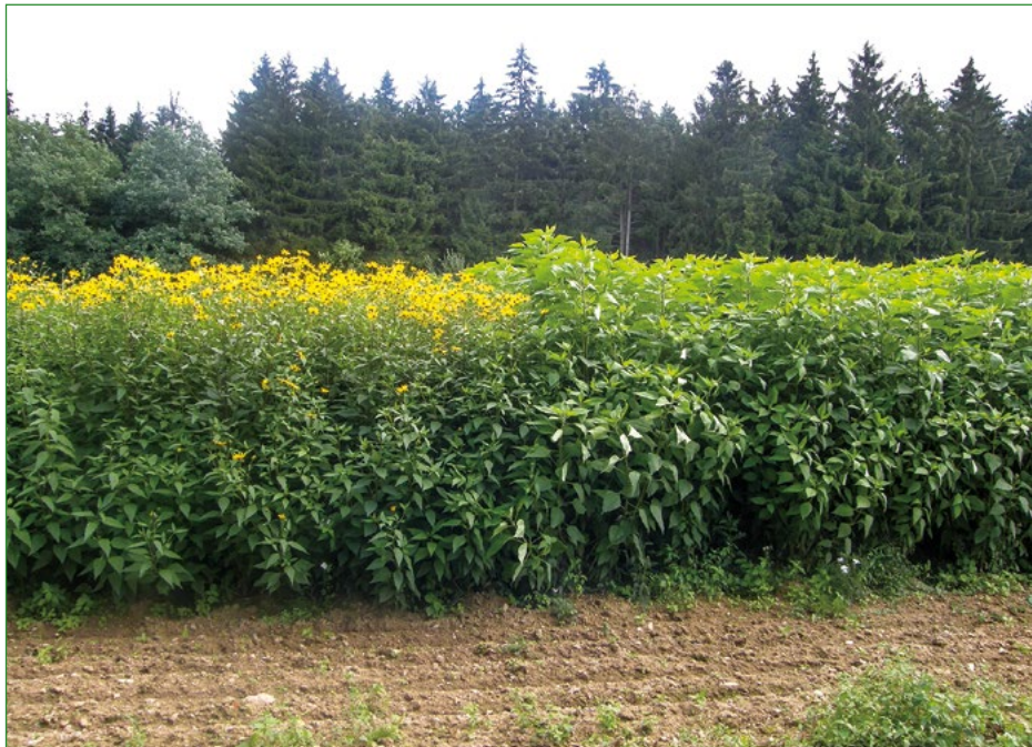
Obr. 5: Porost topinamburu s různým typem natě

Z pohledu využití topinamburu pro produkci natě (krmné nebo energetické využití) jsou rozhodující produkční schopnosti nadzemní části jednotlivých klonů topinamburu. Mezi sledované parametry patří především výška natě, doba kvetení, výnos čerstvé hmoty natě, obsah sušiny a výnos sušiny natě. Výška natě se v závislosti na odrůdě pohybuje od 180 cm po více než 300 cm.