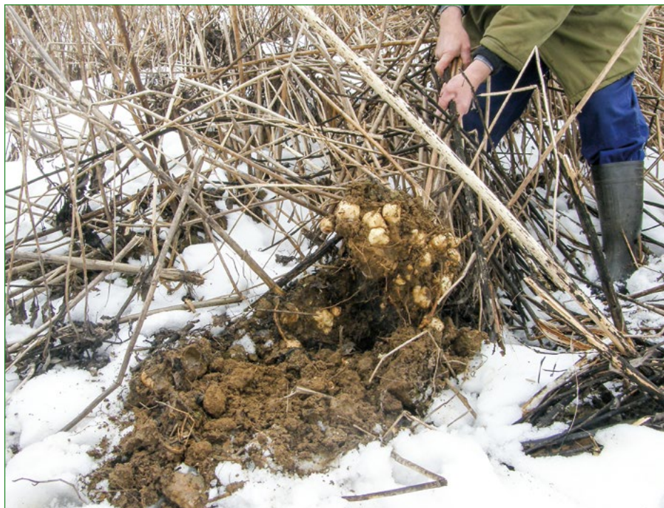
Obr. 4: Sklizeň hlíz v zimě

Výnos hlíz záleží na mnoha faktorech (odrůda, způsob pěstování, hnojení, spon výsadby a podobně), lze však konstatovat, že je srovnatelný s výnosem hlíz brambor.