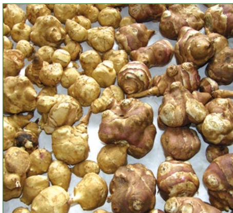
Obr. 1b: Hlízy topinamburu